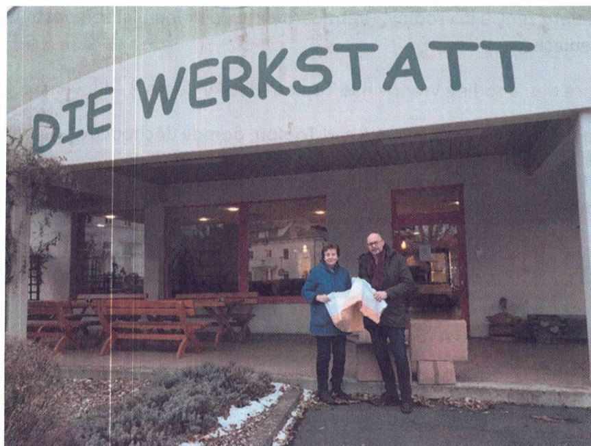
Odovzdanie vecného daru Spoločnosti Domu Karla Schuberta